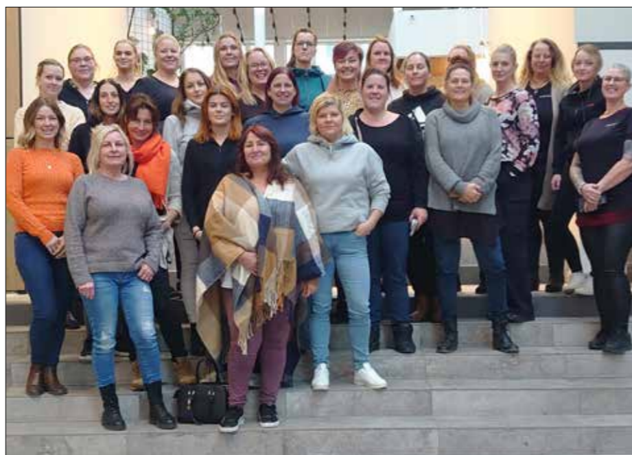
Aurora är nätverket för alla kvinnor i branschen. Nästa år kanske ännu fler av de ca 800 kvinnorna i branschen hittar dit!

Vi i styrgruppen är jättenöjda och ser fram emot nästa nätverksträff!