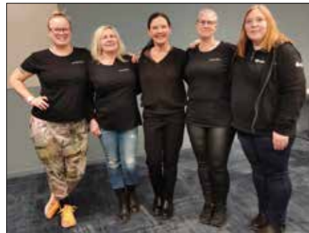
De fantastiska kvinnorna som gör Aurora till vad det är.