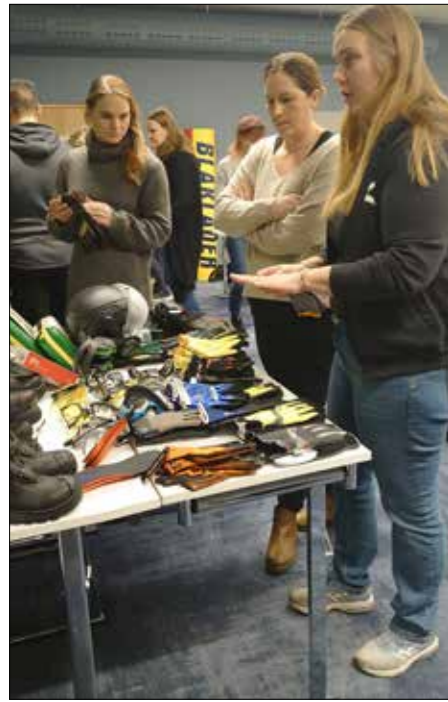
Alla deltagare fick möjlighet att prova, klämma och känna på nya arbetskläder.