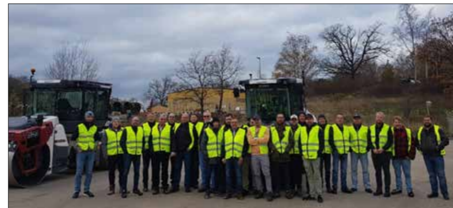
24 av totalt 31 skyddsombud på våra alltid så populära skyddsombudsdagar.

Den 16 – 17 november var skyddsombuden i Skanska region väg och anläggning syd som består av Skåne, Blekinge, Småland Öland och Gotland samt Schakt o Transport distrikt syd samlade för de årliga skyddsombudsdagarna som i år var förlagda till Karlskrona.