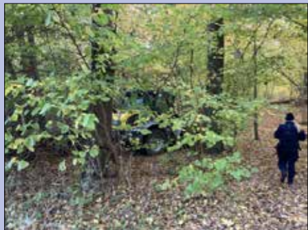
En återfunnen hjullastare.