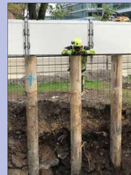
NCC förstärker Solnavägen.

- Igår sköt jag fyra gäss. - Vilda? - Nej, men du skulle ha sett ägaren.