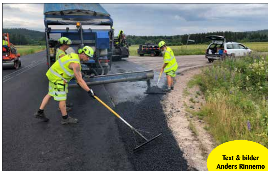
Text & bilder Anders Rinnemo

Väg & Ban Värmland-Örebro har varit ute på arbetsplatsbesök hos NCC. Lag 63 lägger sidoytor med Vögle 1303-3 samt Sprider efter Reparvern som kört vanlig konventionell beläggning. Sträckan är 11 km lång och utförs på länsväg 241 Munkfors - Annefors. Laget består av: Tomas, Mikael, Henrik & Hugo.