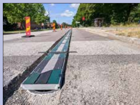
Bild från Getingevägen i Lund, där motorcyklister upplevde det ordentligt halt.