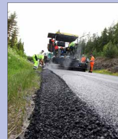
Totte Centerdal lånade denna tjuvig bild från Peabs bildarkiv.