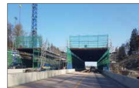
Trafiken har passerat hela byggtiden

Målet är att underlätta för djuren att ta sig över vägen och att minska antalet viltolyckor.