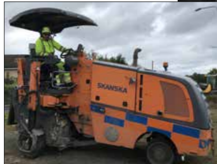
Christer Årdh på 1 meters fräsen

När jag pratade med dem var de nästan färdiga och skulle flytta till Skövde för att starta nästa morgon med ett nytt fräsningsjobb.