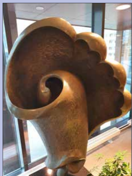
Detta konstverk heter "Lyssna".