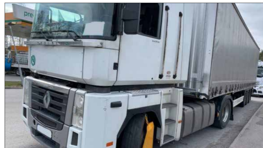
Polisen har klampat ett utländskt ekipage efter att de brutit mot reglerna.

vid alla transporter som ett utländskt transportföretag utför inom Sveriges gränser. Det kommer att försvåra för oseriösa aktörer att konkurrera genom att dumpa löner och villkor.