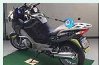
De rätta svaren var: Pilbåge

Förra numrets tävling var tydligen svår. Ingen hade alla rätt på Olabadola rebusen. Ett tröstpris kommer att skickas till en av de som tävlade.