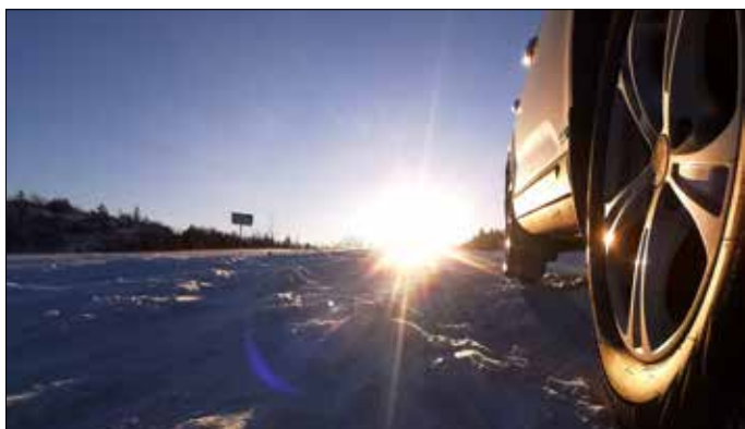
Stora Dundret vid Gällivare.