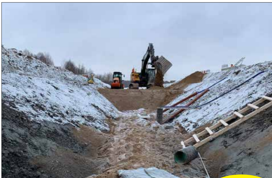
Text & Bild: Patrik Norberg

På plats finns Skanska, Nor-schakt AB och Hedbergs Gräv och Lasttjänst.