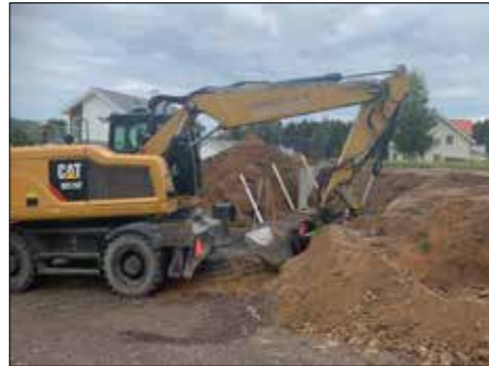
Jordells sätter L-stöd i Kil.