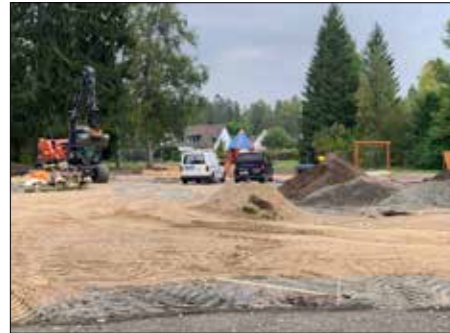
Axeda ny lekplats i Karlstad.

Vecka 40 genomförde Seko den årliga medlemsveckan. I år givetvis med coronasäkert avstånd. Här kommer några bilder från aktiviteten.