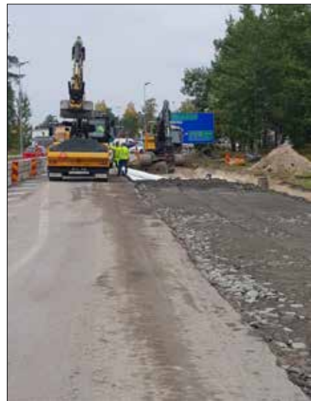
NCC breddar väg i Karlstad.