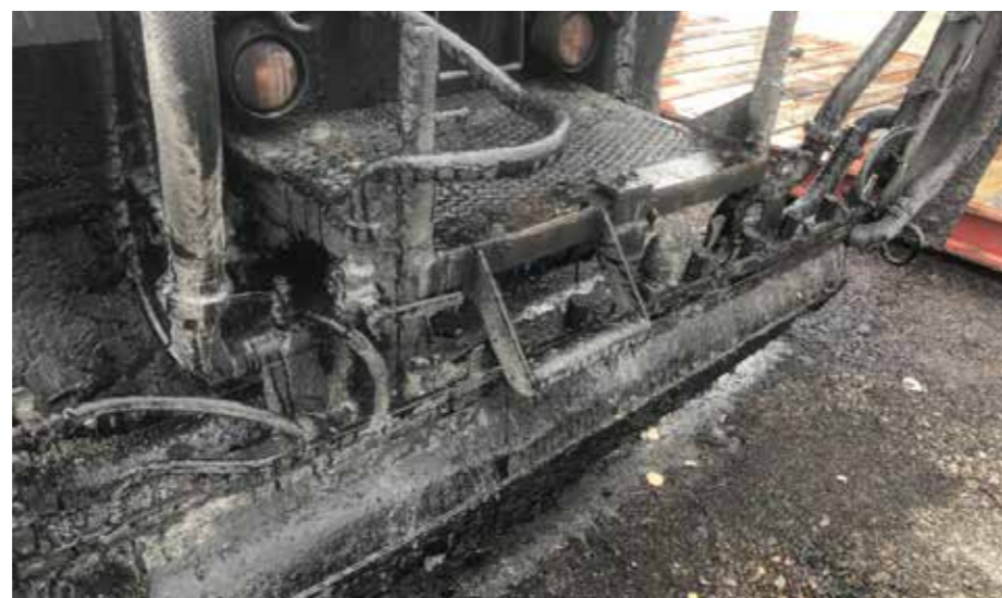
Letade efter en klisterbil i bildarkivet och hittade denna tjugiga bild... Klisterbil är det visserligen, men jag tror det är en Volvo. //Red