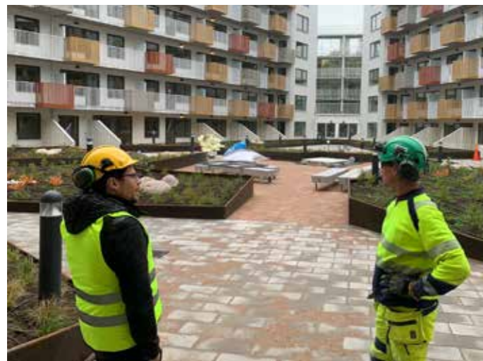
Skanska på en innergård i Karlstad.