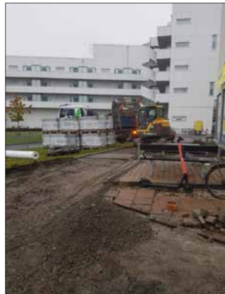
PTMAB jobbar med utemiljö i Örebro.