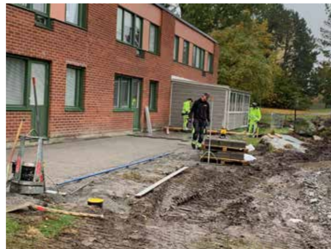
Tranab på en innergård i Örebro.