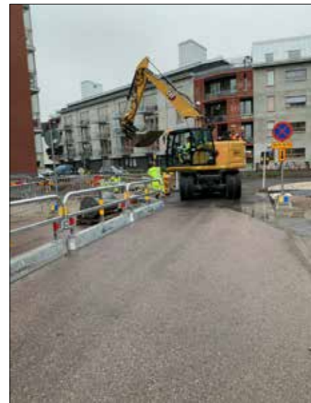
Skanska lägger fjärrvärme i Örebro.