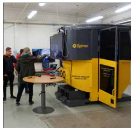
Ninni visar tunnelborrsimulatören.

I projektet har man arbetat fram och uppdaterat yrkesprofilen för bergarbete för att få den nivåbedömd mot SeQF nivå 4 (Sveriges referensram för kvalifikationer). Utifrån de nationella kursplanerna och yrkesprofilen arbetar man sedan fram ett utbildningsmaterial som ska bli tillgängligt för elever och andra som vill få mer kunskaper inom yrkesområdet. En mängd olika aktiviteter har genomförts i projektet och många erfarenheter kommer att presenteras i en kompetensförsörjningsstrategi som ska kunna bli ett stöd i företagets arbete med kompetensförsörjning.