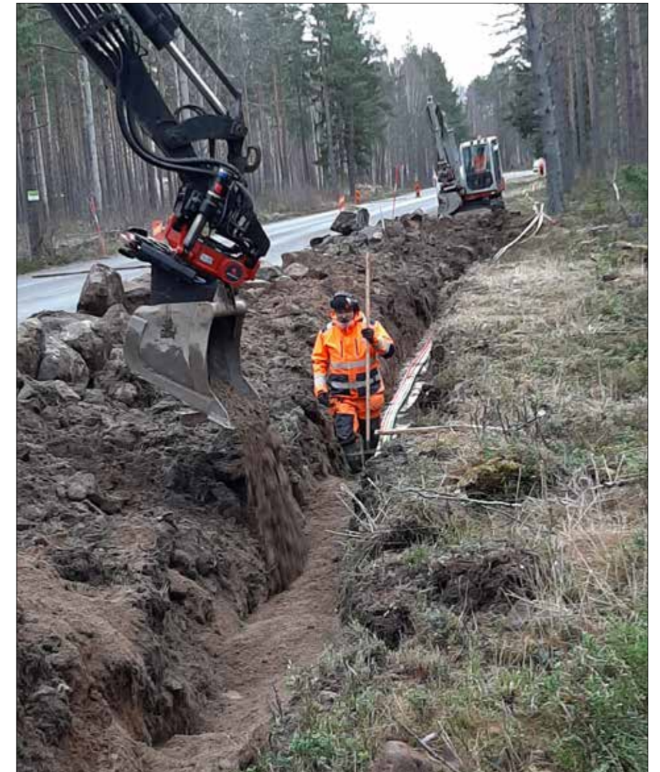
I Forsbacka jobbar MB gräv & last AB med att lägga fiber.

Våga ställa frågan på din arbetsplats. Många som inte är fackanslutna har aldrig fått frågan och då blir det inte av att ansluta sig.