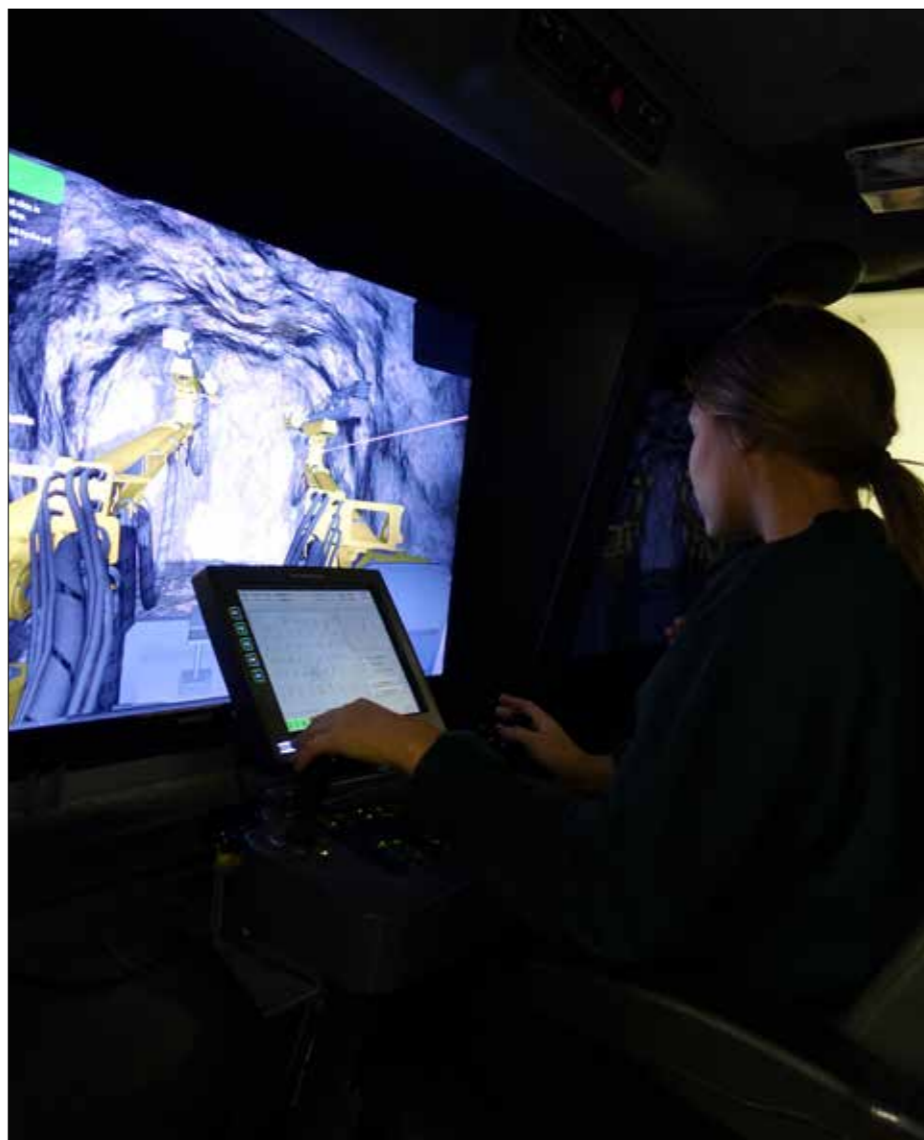
Vy innifrån simulatören när dom borrar.

Bergshantering/bergarbete är den yrkesutgång på bygg- och anläggningsprogrammets inriktning mark- och anläggning. Utbildningen är inte så känd och det finns ett fåtal elever på de orterna som bedriver utbildningen, trots att bergarbetare är eftertraktade både inom gruvarbete och infrastrukturprojekt både ovan jord inför olika byggnationer och under jord för att bygga tunnlar och andra utrymmen. Stora byggprojekt pågår både på Väst-kusten och runt Stockholm, samt andra projekt som vindkraftsbyggnationer, bergtäkter med mera.