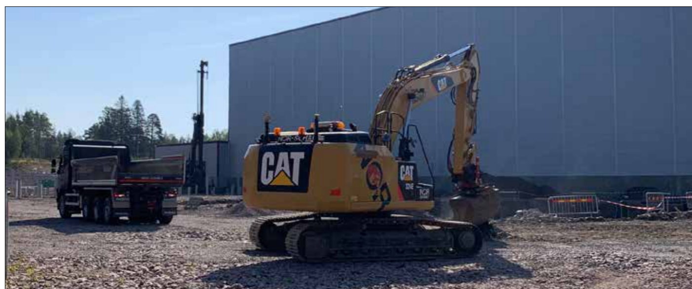
Från bygget av Löfbergs nya rosteri i Karlstad.

Skicka in en bild från ditt jobb och berätta kort vad ni gör så är du med i utlottningen av hockeybiljetter. Vi drar 2 vinnare under vecka 46 som får 2 biljetter vardera. Du väljer själv om du vill se Färjestad eller Örebro. Bilderna kommer i nästa nr av tidningen.