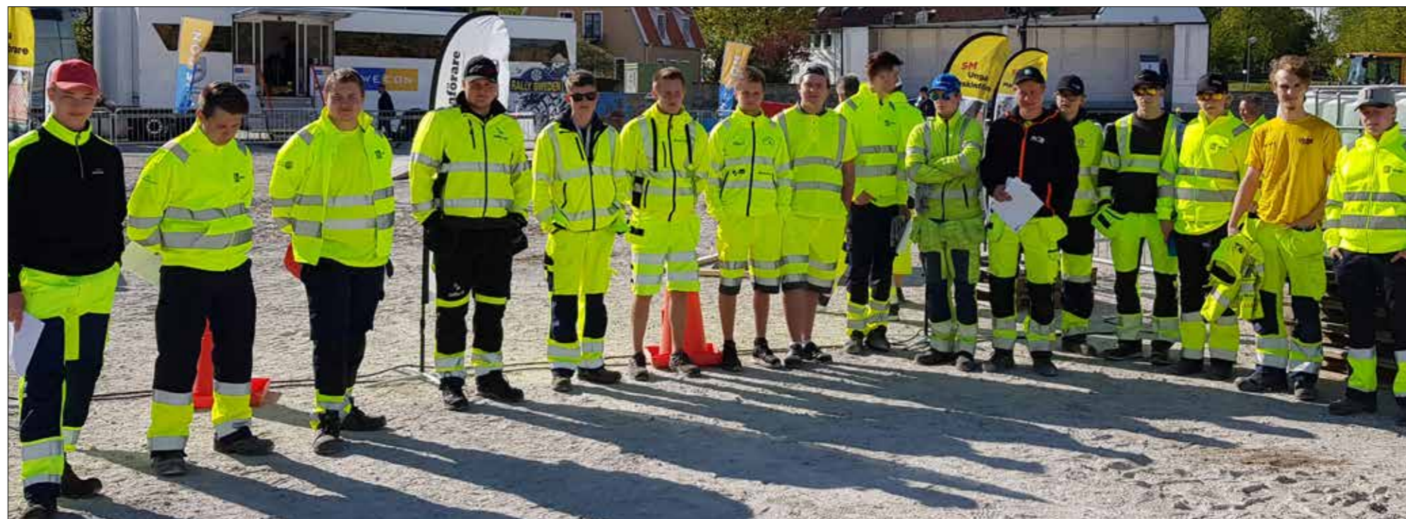
Alla arton tävlande elever.