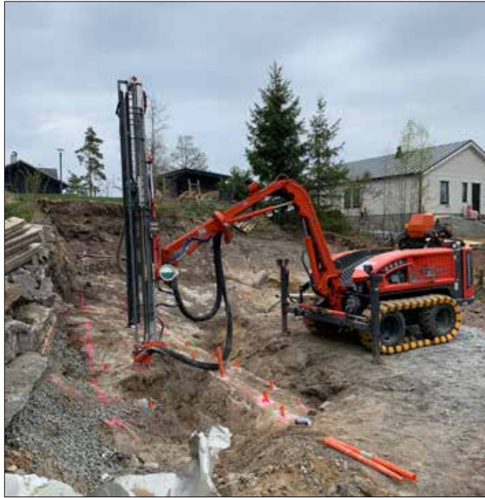
Hammarö bersprängning borrar och spränger för nytt garage på Hammarö.

Införda bilder belönas med en trisslott.