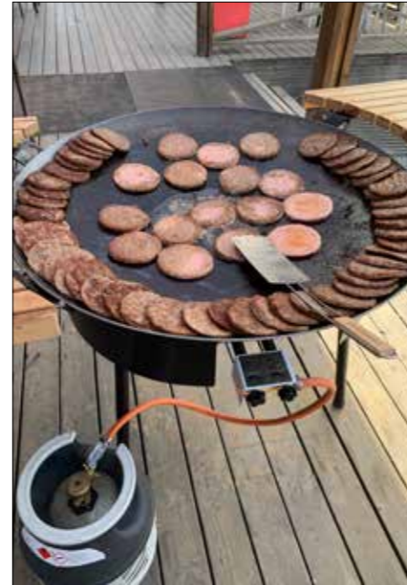
Laddat för mat.