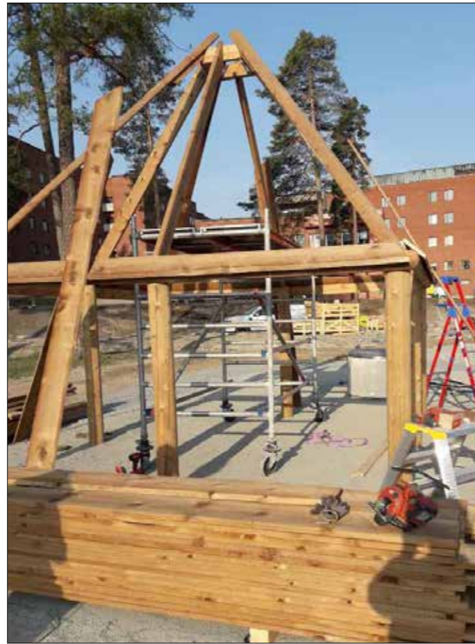
Skanska monterar ny lekutrustning i Säffle.