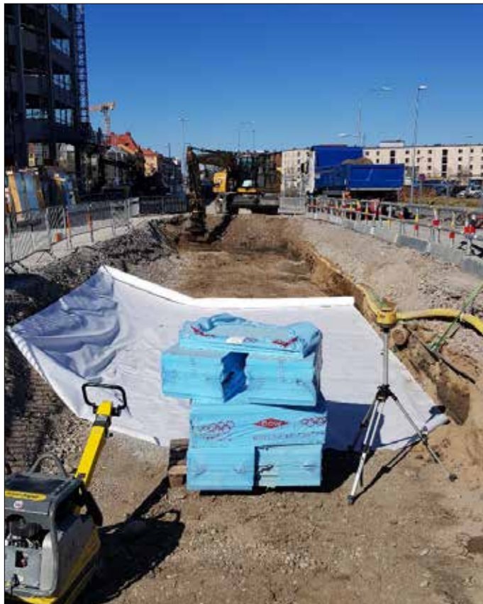
Ncc i Örebro bygger vattenmagasin vid sjukhuset i Örebro.

Skanska lägger ny rörbro som är 34 meter lång och 2,5 meter bred, tillsammans med maskiner från Forsås och Nor-schakt. Eftersom rörbron ligger i ett villaområde korsades den även av vattenledning som behövde bytas.