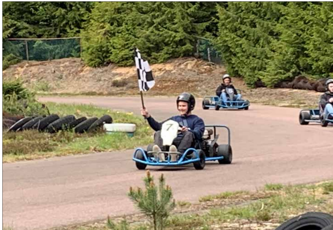
Segraren i finalen dag 2.