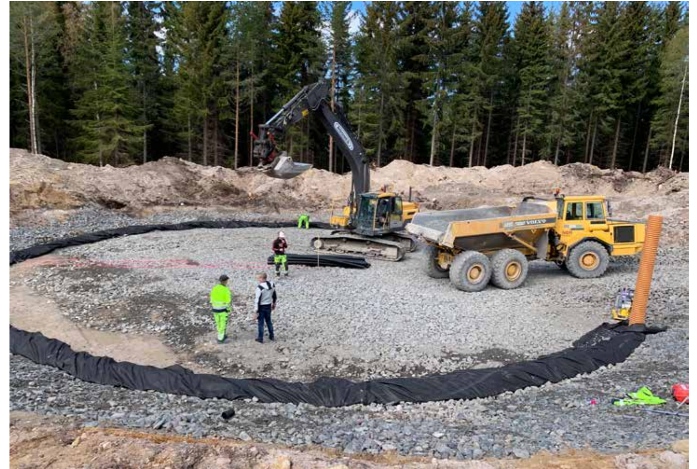
Här kommer ett av de 31 vindkraftverken att resa sig mot skyn.

När vi var på besök var det ca 30 personer som jobbade i projektet. Det byggs 31 verk med en totalhöjd på 200 m som årligen kommer producera upp till 400 GWh el, tillräckligt för att förse en stad som närliggande Kristinehamn med el under ett år. Men det krävs mycket jobb innan det är i produktion... 2,5 mil kabel ska förläggas och det ska byggas minst lika många mil nya vägar mellan alla verken. Projektet beräknas vara klart slutet 2020.