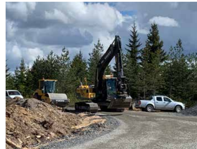
Många mil väg blir det...