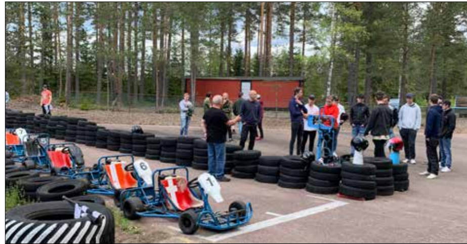
Förarmöte inför finalerna.

Totalt är det ca 150 elever som är inbjudna att delta under dom två dagarna. Under dagen bjuds det även på grillade hamburgare och gokartkörning på gokartbanan i Kil.