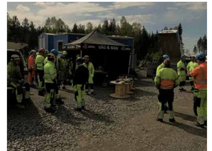
Det är inte många som tackar nej till lite käk.