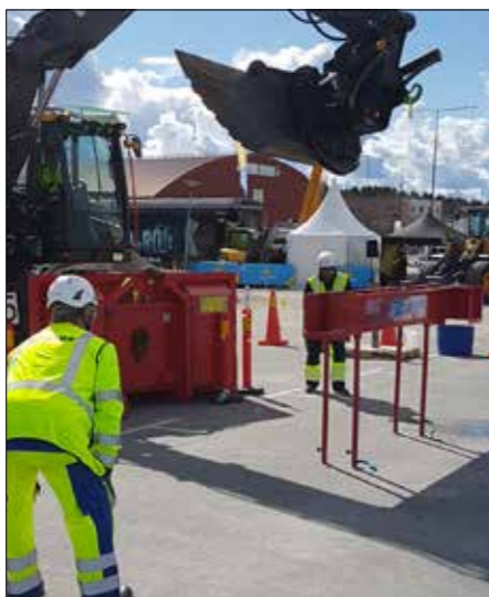
Den klassiska föra en hink genom en ränna utan att röra väggar eller golv.