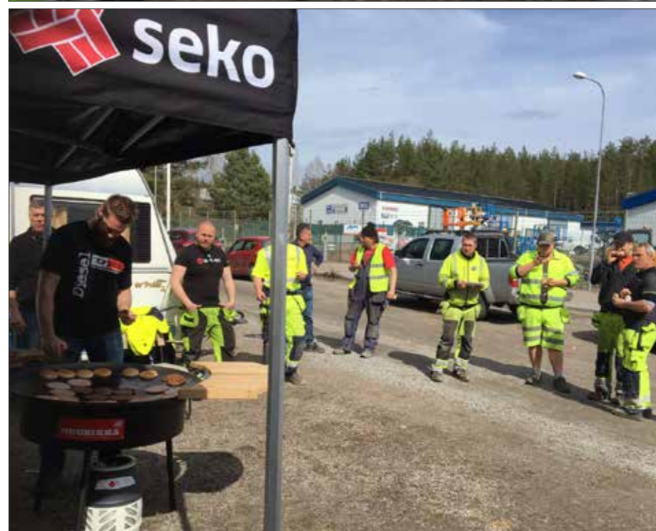
NCC får mat och information vid grillen.