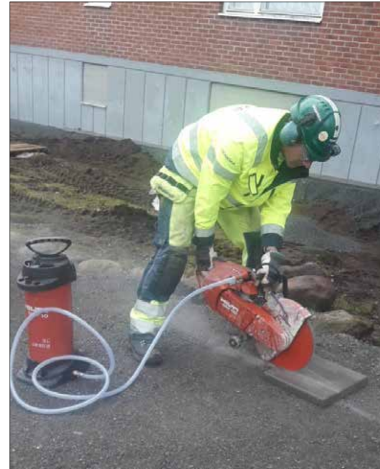
Kapning med vatten i en tryckspruta utan damm bildning.

Med anledning av det kraftigt ökande antalet olyckor vid användning av motorkap har flera av de större byggföretagen börjat med internutbildning för användande av motorkap. Många i branschen vill att det ska vara körkort på motorkap som det är på motorsågen. På motorsågen finns det kastskydd, något som saknas på motorkapen det borde finnas även på den om det är möjligt.