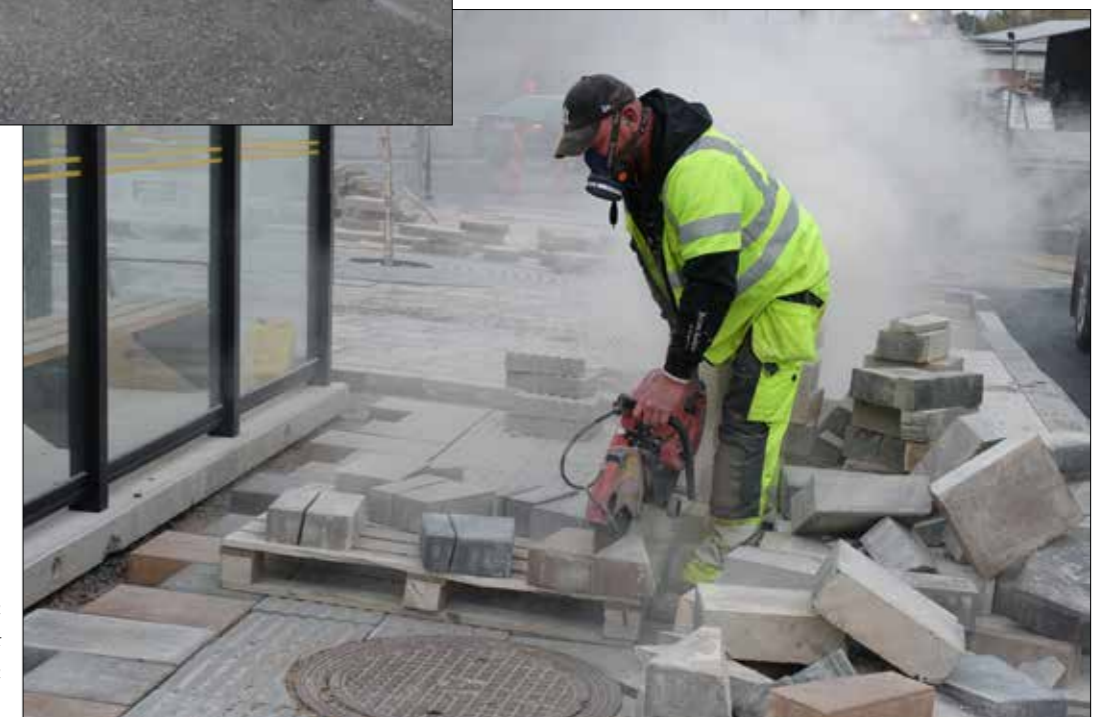
Kapar utan vatten med ett stort dammoln bakom sig.