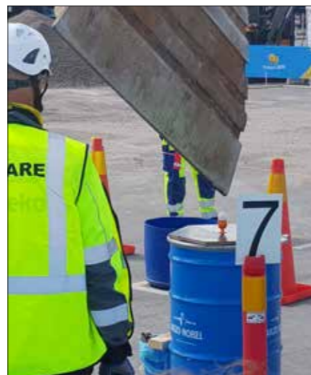
Och den lika klassiska knäcka ägg med skopan.