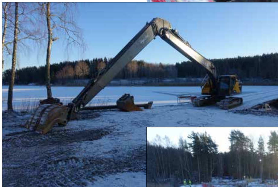
”Lång Eriks” maskin.

Det är trångt när skopan ska ner mellan alla stag i fångstammen.