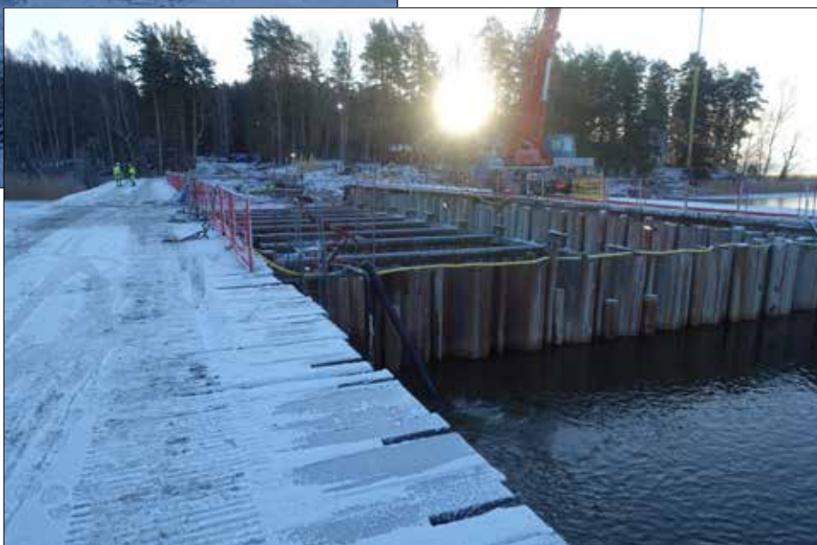
Den tillfälliga bron och fångstammen.