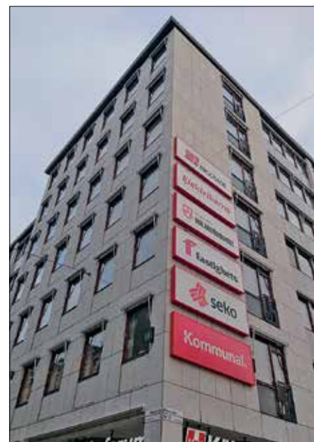
Huset på Hagagatan 2 delas med övriga 6F's förbund samt Kommunal.

Sedan den första november 2017 arbetar hon på Seko's förbunds kontor på Hagagatan i centrala Stockholm, som central ombudsman för Väg- &