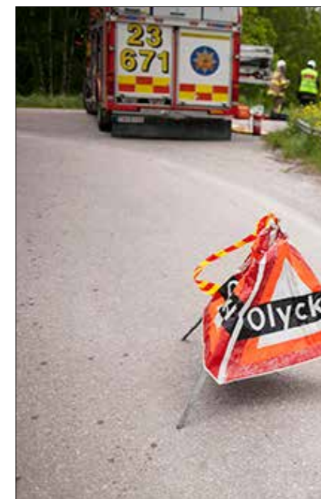
En olycka är en olycka för mycket!

UNDERENTREPRENÖRSGRUPPENS mål är att förbättra arbetsvillkoren för våra medlemmar som arbetar som underentreprenörer.