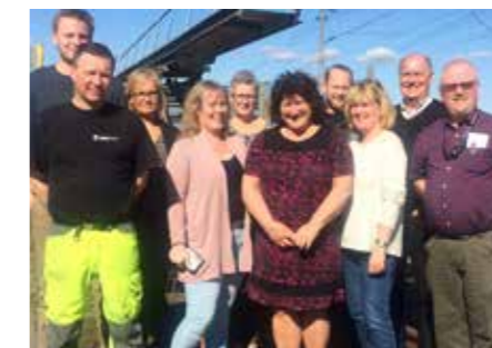
Styrelsen i Seko Trafikverket sektion Syd på Rälsverkstaden i Sannahed.