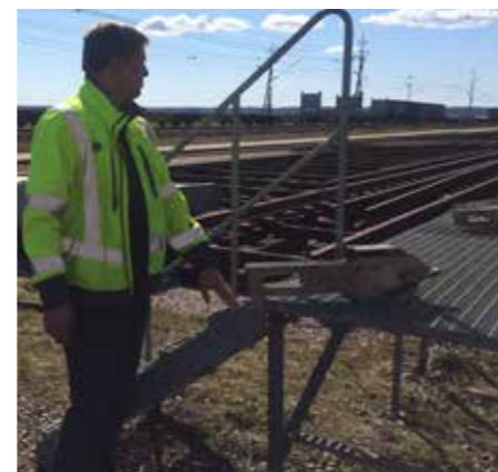
Innan skenan dras upp på rälsvagnarna fäster man en "rälssko" i ena änden som hjälper till att lotsa skenan rätt genom hela vagnssätet, dryga 420 meter.

Det är både roligt och intressant att se på när yrkesskickligt folk arbetar. Sammantaget ett mycket bra besök på Sannahed, så ett varmt tack till hela gänget för att vi fick komma och besöka anläggningen.