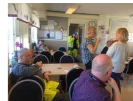
Seko-fika med delar av personalen.