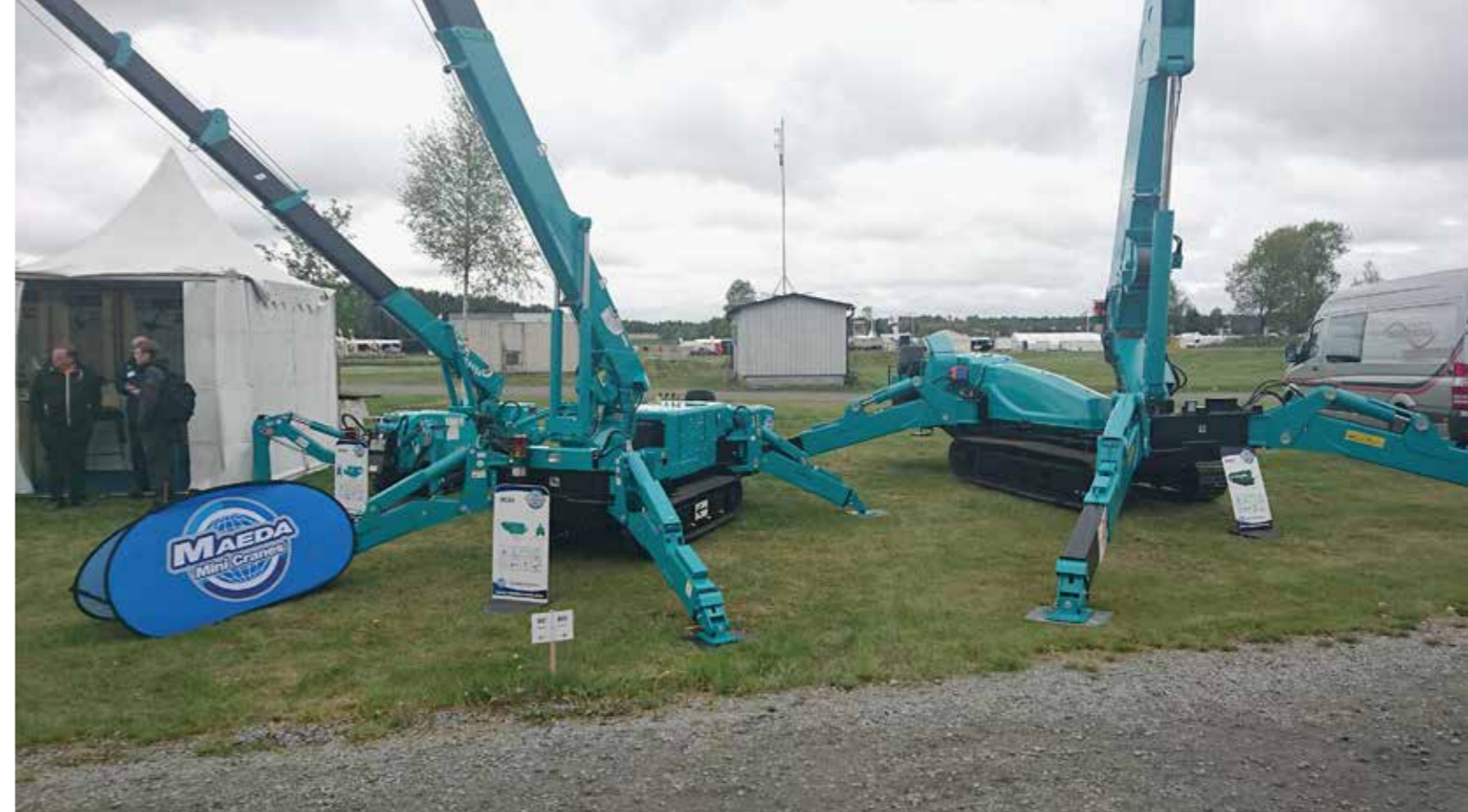
Vart tar dom vägen, armarna på minikranarna? Det ser ut som stora spindlar under anfall. Från vänster, MC 285 lyfter drygt 2,8 ton. MC 305 lyfter nästan 3 ton och har en maximal radie på drygt 12 meter. MC 815 har en grundbom på 19,4 m och 8 tons grundkapacitet. Bilden nedan. Man undrar hur många som suttit och arbetat i denna maskin, modell äldre? Komforten har sannerligen utvecklats genom åren.