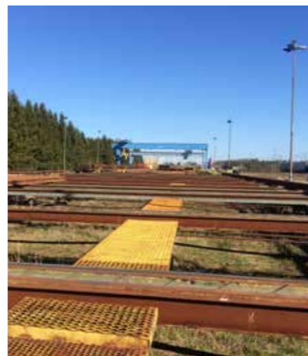
Vy över rälsupplaget, med travers i fjärran.

Vid frågor är du varmt välkomna att kontakta din klubb eller ditt regionala skyddsombud!