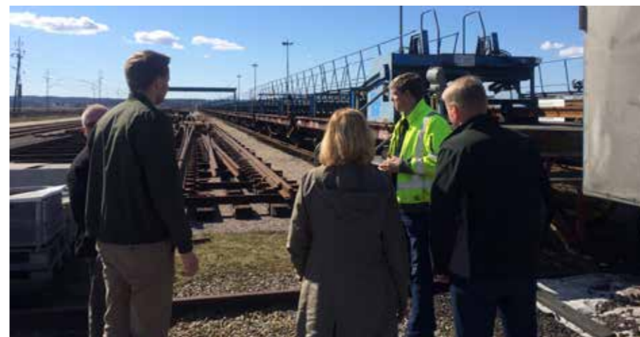
Bredvid ligger ett upplag med växelkryss och växlar för Hallsbergs och Stockholmsområdet.

Lagerhållningen är numera i Sannahed på grund av de många stölderna när materialet låg utplacerat mera lokalt.