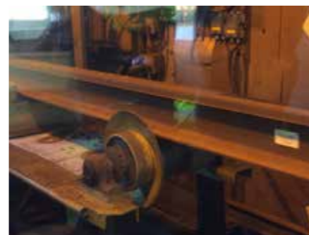
Sliphuset. Här slipas det sista av det överblivna stålämnet bort.

Lagerhållningen är numera i Sannahed på grund av de många stölderna när materialet låg utplacerat mera lokalt.