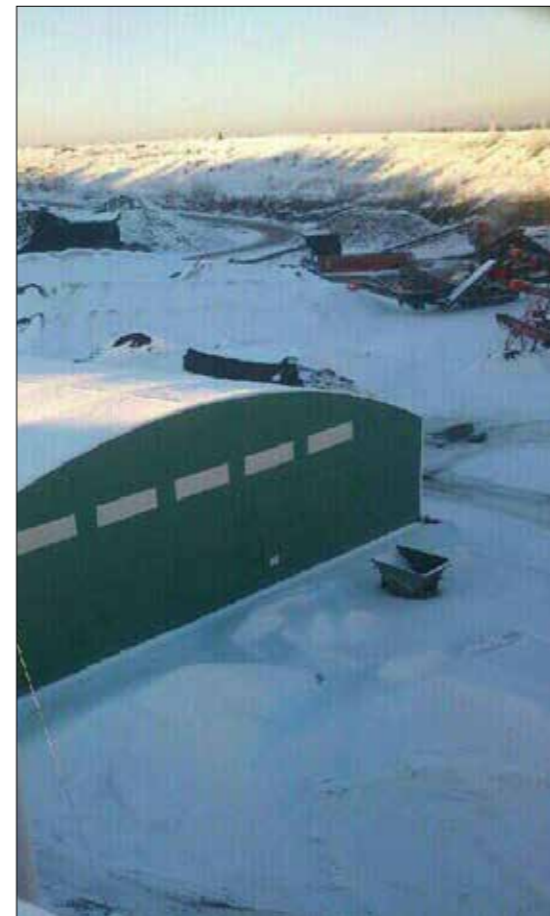
Vy över tälten i Veberöd som asfaltverket står i.