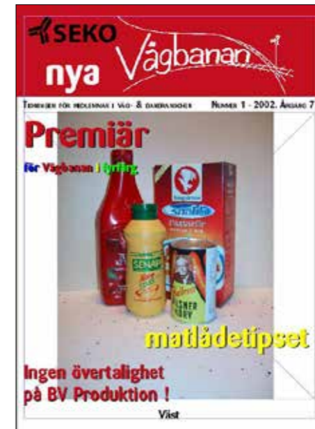
2002 gick vi över till fyrfärgstryck.