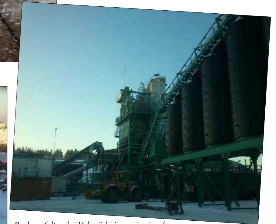
Peabs asfaltverk i Veberöd i januari månad.

Övriga vintermånader är det full fart med reparationer av verken, så att de ska stå driftklara inför beläggningssäsongen.