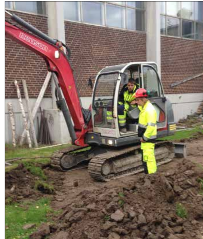
Skolungdomar från Herrgårdsgymnasiet i Säffle får besök...