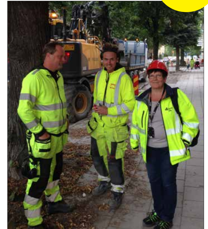
liksom Bro&Väg i Västerås. Mitt i stan, där man håller på med VA-jobb, ny väg och återställning.